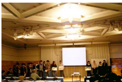
まちなか発表会の様子