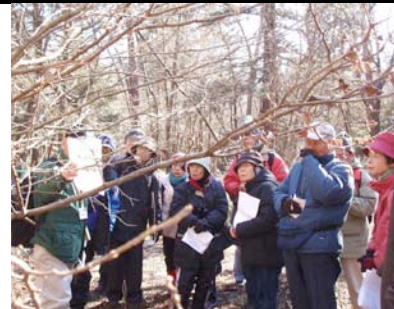
サワフタギの冬芽を見る