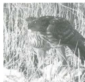
ダイサギを食べるオオタカ (幸手市にて青柳進さん撮影 埼玉県生態系保護協会「ナチュラルアイ」No.251, 2008年2月号掲載)