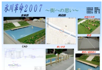
まちづくり提案の例

1月22日午後、川越プリンスホテルにて図形処理演習「まちなか発表会」を開催しました。このイベントは、東洋大学が今年度文部科学省から採択された現代GP（現代的教育ニーズ取組支援プログラム）「持続型共生教育プログラム：川越学」の一環として行ったもので、正課の授業で行っている演習の発表会を、まちなかで公開で行うことによって、地域の方々にその成果を報告しようというものです。