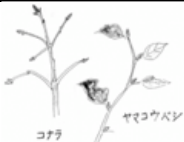
コナラとヤマコウバシの冬芽