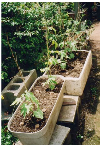
苗を植えて10日目。4月30日 (市販の苗4本)