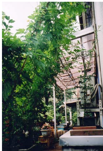
植えて60日目。緑のカーテン。花が 咲き実が成る。6mまで。