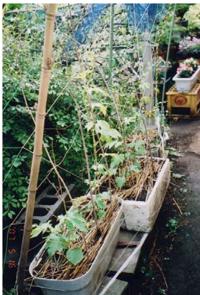
植えて16日目。わらを敷く。 キュウリ用の網を張る。