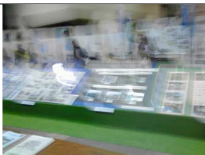
和光の「水と緑」などの活動展示