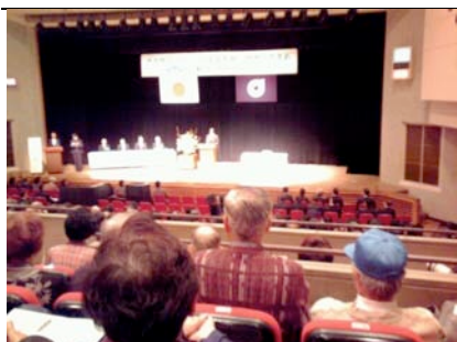
秋篠宮さまのお祝いのご挨拶