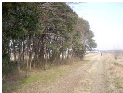
小畔川土手に残る貴重な雑木林