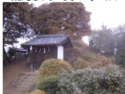
築山がある富士講の浅間神社