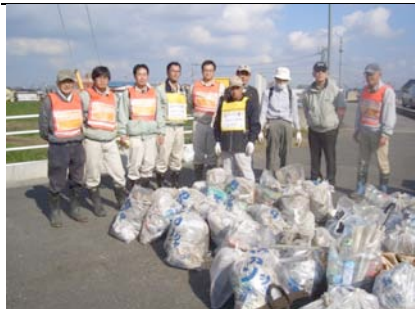
第1回清掃で集まったごみ