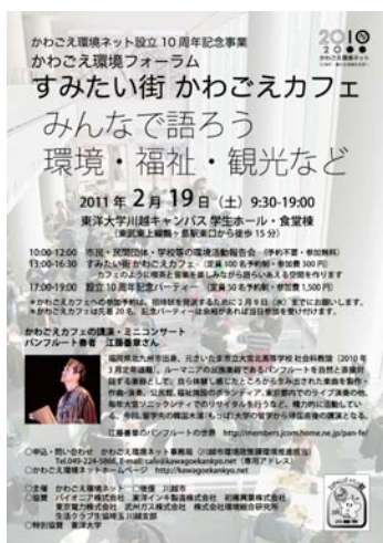
「かわごえカフェ」の周知ポスター

(13:00-16:30、参加費 300 円、参加予約 2月9日必着、当日参加先着 20名)