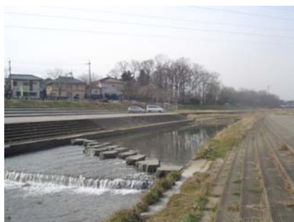
水辺再生で工事が始まる小畔川