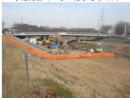
御伊勢塚橋下の土手補強工事