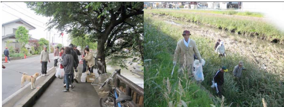
ごみゼロデーでは、子供も老人も 「新河岸川を守る会」の河川清掃

かわごえ環境ネットもスタートして10年たちました。川越市は環境先進市といわれています。太陽光発電設備は、小中学校をはじめ公民館や保育園などの公共施設に設置されました。市民の住宅向けの太陽光発電設備設置への補助金は、2008（平成21）年度までに1,619件に達しました。さらに「エコチャレンジスクール」「エコチャレンジイベント」「エコチャレンジファミリー」などの環境意識の啓発へのアイデアを集めた「川エコの知恵」が進められています。