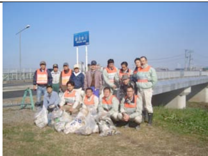
2回目は多くの人が参加した