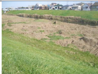
川べりに絡まったごみもきれいに

2010年の秋のごみゼロ運動が台風予報で中止になり、市内の各地で放置ごみが目立ちました。新河岸川岸の土手や川べりにもごみが目につきました。11月16日の新河岸川景観プロジェクト企画のサイクリングでも、土手から岸辺に絡まるごみが気になりました。