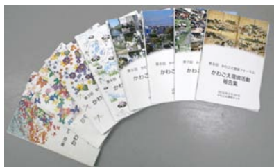
歴代のかわごえ環境活動報告集

市民・民間団体・学校等が、これまで環境活動をしてきた成果を報告することで、活動の相