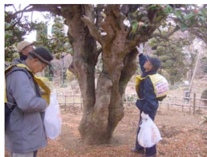
樹齢を感じる「さざんか」の古木