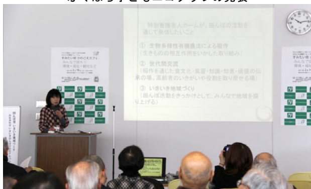
みなみかぜの発表

スタッフは8時半から会場設営にあたり、160ページにわたる「かわごえ環境活動報告集」も揃い、9時半に小瀬理事長のあいさつで始まり、午前の第1部「環境活動報告会」では、9題の活動報告が行われました。