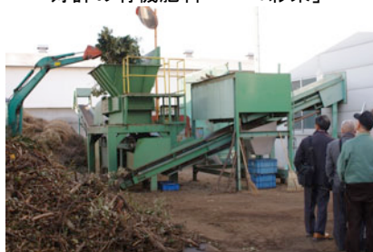
剪定枝をチップに裁断する