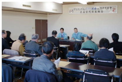
清掃組合の職員からの説明

終わって、この組合の大処理工場の煙突に展望台が設けられているので、特に便宜を図ってもらって昇りました。田園と市街地が広がる東埼玉の景観を眺め、帰途につきました。（原嶋昇治）