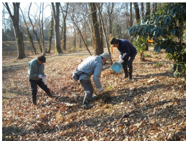
斜面帯でキツネノカミソリの種まき