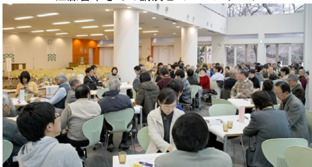
「かわごえカフェ」の全体セッション 「かわごえカフェ」のスケジュール