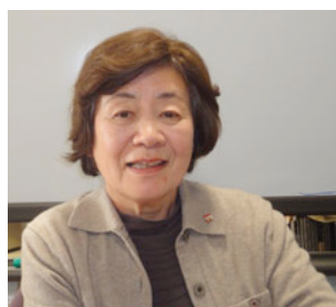
エコの生活環境の活動を語る

「私の環境活動は、人と人のつながりの中から始めています。」「大東公民館の活動で作った女性の会、『きんもくせい』は10人の会ですが、月毎の定例会を開き、生活環境の勉強会を続けています。」「身近なエコを行う会話から始まる定例会。水道水の水は、鉛筆の太さ。茶碗洗いは手桶の貯め洗い。」「時には、渋谷の電力館への見学で見聞を広げています。」「地域活動の配食で、一人住まいで昼間の電気が点いている家には、玄関、勝手口に立ち声掛け元気確認を行います。」「今は、便利を取り入れての生活が多く、電話・パソコンで交わしている会話で、親しくなったと錯覚してしまう方が多くなっている。」「親しさは、顔を合わせて五感をフルに使っての対面会話から生まれま