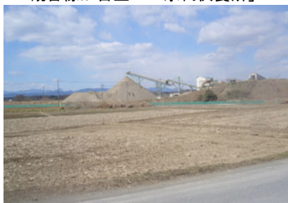
長瀬池跡のまわりも砂利の山で