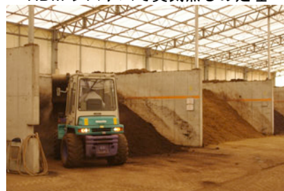
コーナーごとに熟成へ