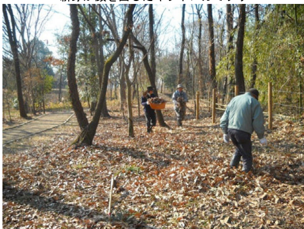
枯葉を集め、踏み固めて落葉溜め造り