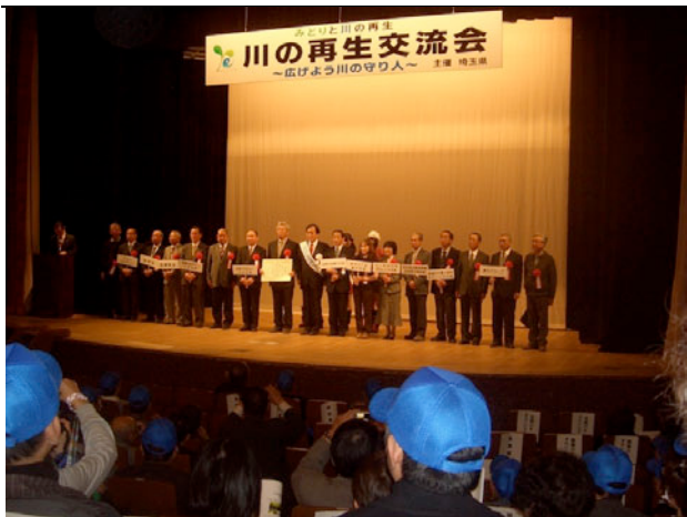
知事を囲んで表彰された各団体の代表

「川の国埼玉」の川の再生に力を入れている埼玉県では、1月29日にさいたま市の埼玉会館で、上田知事も出席して「川の再生交流会」が