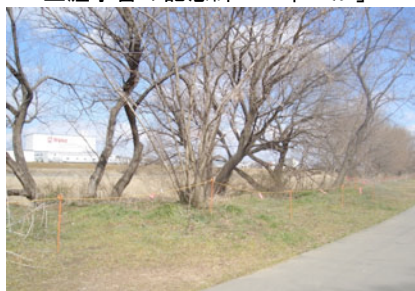
ニワウルシの大木が並ぶ入間川右岸