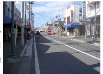
地元密着の霞ヶ関北商店街

前号の巻頭言で、自治会連合会が地域の「絆」の大切さを訴えておられましたが、毎日の生活に必要な買い物を通じて自治会と商店街の連携を深めることが必要でありましょう。商店街と自治会の役員や民生委員・環境推進員などの地域の皆様方との横の連絡を密にして、市民の日常生活を助け、川越市の総合計画の目標である「生き生き川越」になり、「住みつけたいまち」になるのが“夢”であります。