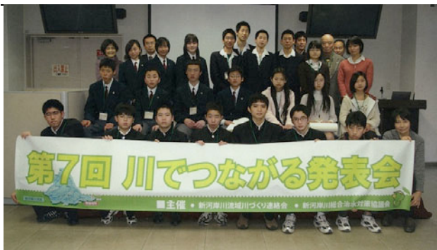
小中高生に大学生、社会人も参加した

荒川下流河川事務所の調査課が事務局を務める「新河岸川流域川づくり連絡会」主催の「第7回川でつながる発表会」が、2月13日、北区の岩淵水門近くの「荒川知水資料館アモアホー