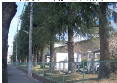
市の保存樹木ヒマラヤスギの列