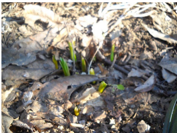
新芽が顔を出したキツネノカミソリ

次回は、3月にキツネノカミソリの新芽がもう少し伸びたところで、新芽周りの除草作業を行う予定です。 (大辻晃夫)