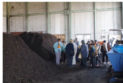
HDMシステムで臭気無しの処理