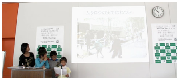
ふくはら子どもエコクラブの発表