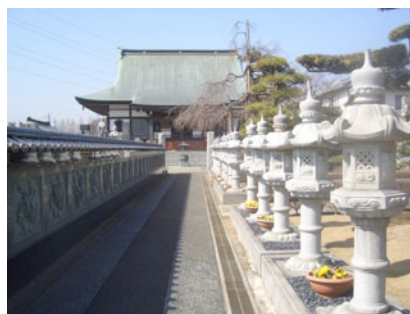
寄進された灯籠が並ぶ最明寺