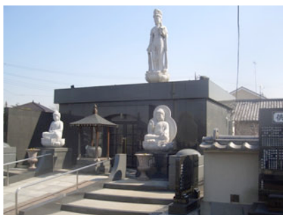
観音像が目立つ「永代供養所」