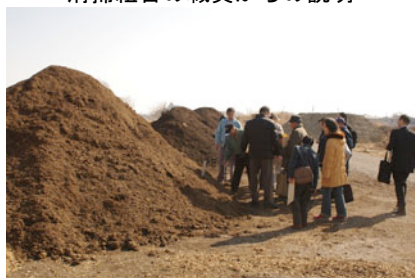
熟成のために山積み