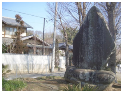
生涯学習の記念碑? 「筆づか」

南大塚駅に近い南台の工場団地で、光村印刷の道路脇に、幹が50センチを越える立派なヒマラヤスギがずらりと並んで、市の保存樹木の標識がかけられていました。工場内には、ほかにモミジバフウやソメイヨシノなど36本が指定されています。(武田侃蔵)