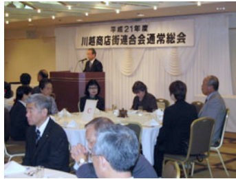
川越商店街連合会通常総会

かわごえ環境ネットがスタートして10年になりました、発足の時から、自治会連合会とともに、私らの会も会員として参加し、環境にやさしいまちづくりに少しでもお役に立てばと協力して参りました。川越市の「路上喫煙の防止に関する条例」が作られる前に、クレアモール商店街で「歩きタバコをやめま