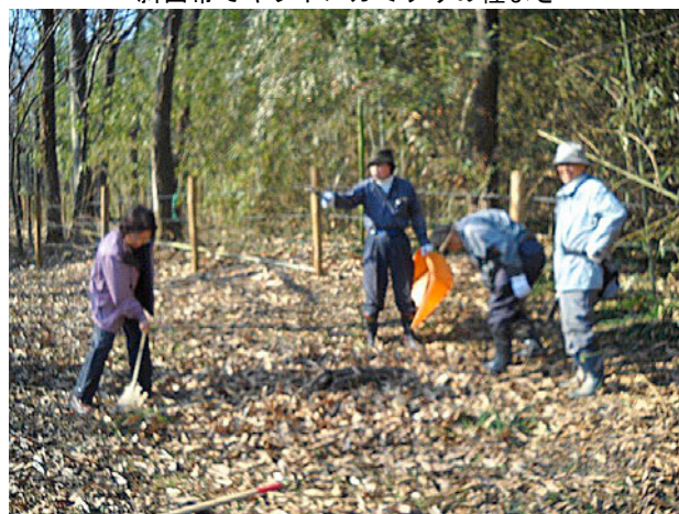
落葉の上に枯れ枝を載せて完成です