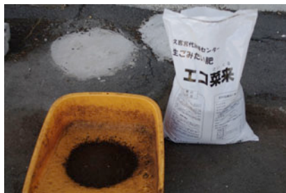
好評の有機肥料「エコ彩来」