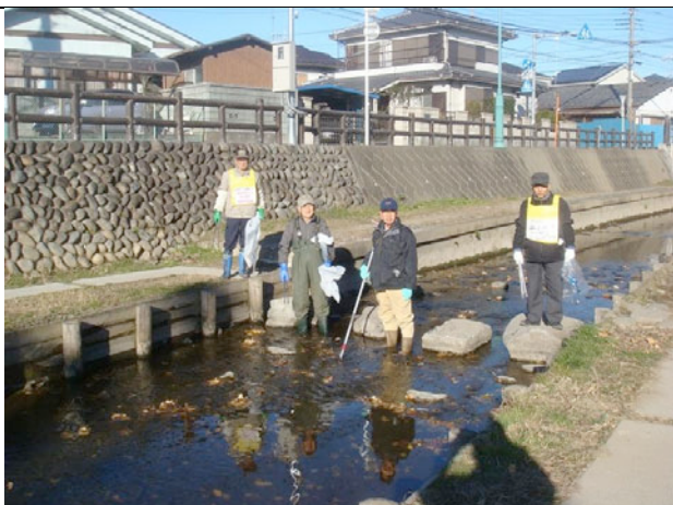
濯紫公園前の新河岸川で

まち美化グループでは、新年を控えた12月23日に市内中心部のクリーン活動を行い、25日には新河岸川の市街地側を清掃しました。菓子屋横丁に近い赤間川公園横から氷川神社裏の北公民館までの間のごみ拾いをしました。