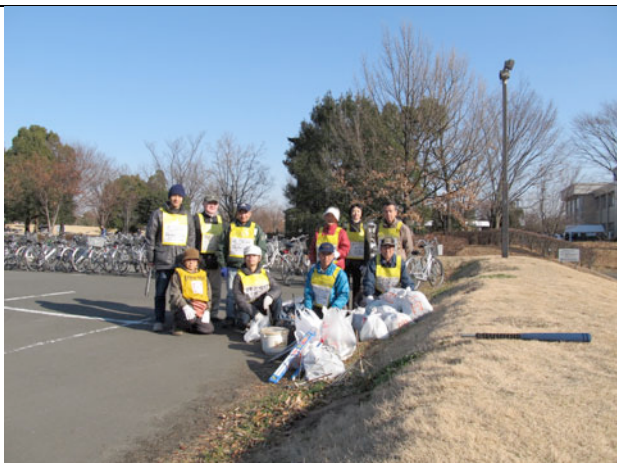
集めたごみを囲んで

若い世代の喫煙率は年々下がっていますが、成人式会場周辺での吸殻のポイ捨てはまだまだなくなりません。社会環境部会のまち美化グル