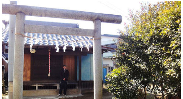
地域環境活動で清掃している八坂神社

「そうでしたか・・・ところで、環境ネットの広報はお読みになっていますか。」「軽く目を通していますが、みんな良くやっているね。」「熱心さが分ります。私なんか近づけないよ。」「勤めている時は、退職したら何か出来るかなと思っていました。」「だけれども退職したら、地域の方に頼まれて、年行事の手伝をするようになってしまい、環境ネットの会には出ていない。」どんな年行事なのですか。 「近くの八坂神社の世話人代表をやっています。」「私の住まいは、石原町1丁目ですが、古い町名は袋町です。」「家数の少ない旧袋町の人が氏子として、節分祭、御稻荷祭講（おいなりこう）、天王様の三つの地域行事を続けている。」 「寄合いでの話が始まり、地域の古老から手順を聴き、間違えないように年行事を済ませている。」「ごみゼロの日には神社の草取り、神社にある樹の伸びすぎた枝を切ったりしています。」