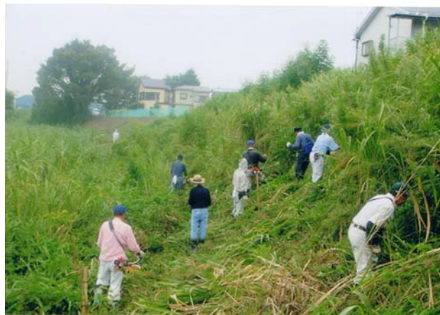
桜の苗木 100本を植え、周りの草刈も行っている

荒川の船運も盛んな地域でもあった。」「鎌倉時代からある八幡神社、巨樹も沢山あったが伊勢湾台風で倒木が多く出て、社殿を守るため伐採されてしまった。」「ほろかけ祭りでも多くの市民が訪れるようになり、文化財としての保存と、全国でも数少ない歴代の徳川将軍家からのご朱印状は大変貴重なものです。」と幅広い地域活動も訥々と語っていただきました。「宮下町の氷川神社裏の新河岸川にある桜は、私の若き頃の昭和30年代と記憶していますが植樹工事に携わった。小さな桜苗木を植えた記憶があり、年月が経つとあんなに大きくなくなって、川越の桜名所となっている。」。植樹は年月を経て良き環境をつくれるとの思い出も語ってくれました。このように地域での環境を意識した自主活動も始めている。