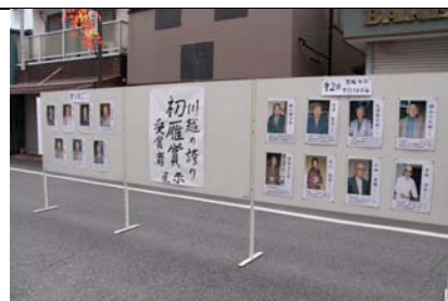
初雁賞受賞者の展示