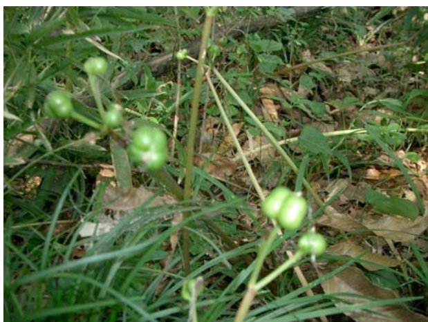
結実したキツネノカミソリの種子