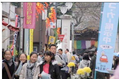
にぎわう立門前通り