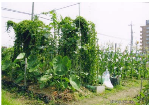
野菜の生育にも経験と工夫が

生物は、春から秋にかけて活発に行動することはご承知のとおりであります。例えば生ごみを処理してくれる“みみず軍団”などは時に思いがけない行動をとります。みみずコンポストの上面保湿のための新聞紙に霧を吹きかけておきますと、それを食べてしまうことがあります。その食欲の旺盛さに驚かされるとともに、その生命力に畏敬の念さえ沸いてまいります。私たちは命を持った生物に囲まれて生活しています。特に大切な食べ物は感謝の心をこめていただくことが大切だと思います。