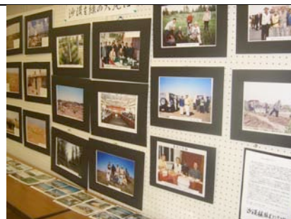
砂漠植林ボランティア活動の写真