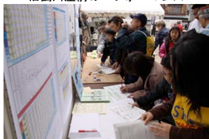
本会ブースでは「かわごえアジェンダ21」チェックシートを実施