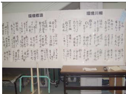
環境標語と環境川柳