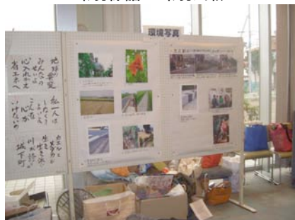
環境都都逸に環境写真