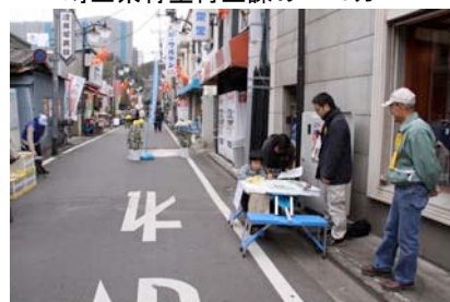
通りでも「かわごえアジェンダ21」チェックを実施しました

11月9日(日)10時から15時まで、10回目を迎えた2008アースデイ・イン・川越 立門前(2008アースデイ・イン・川越 立門前実行委員会主催、本会后援)が、初めてまちなかに出て、蓮馨寺など4拠点を核に、地元商店会の協力も得て、立門前通りを会場に行われました。当日は薄ら寒い曇天でしたが、心配された雨も降らずに予定の行事を終えました。