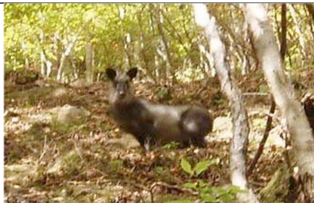
目の前をカモシカが横切り、崖上の安全圏まで上がってじっと我々を見ている。