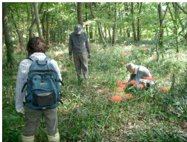
キツネノカミソリの種子を探す