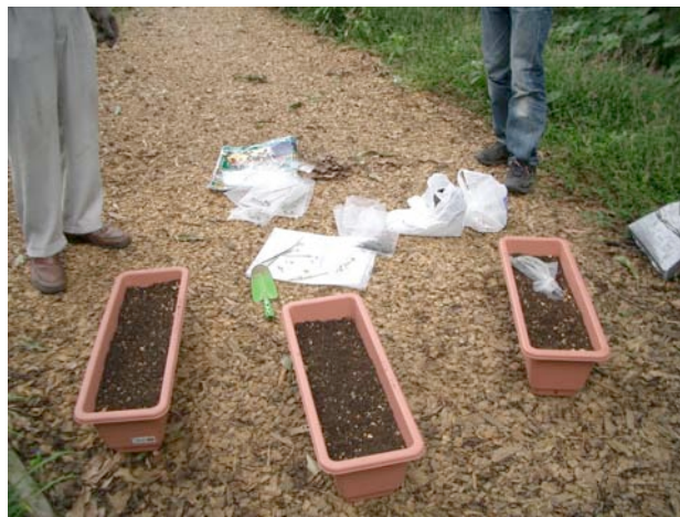
9/26 プランターに種子をまきました