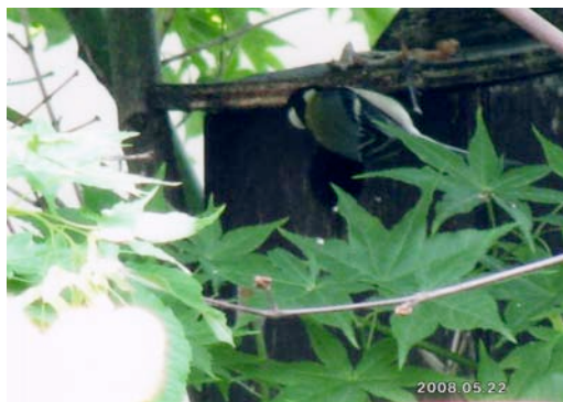
巣箱の穴から中を覗くシジュウカラ

また、庭の隅に小鳥の巣箱を掛けています。ここ 3 年連続でシジュウカラが雛を育てて巣立っています。1 回の巣引きで青虫など 4 万匹を処理すると言われていました。その子育てを観察しますと、親鳥が餌を運んで