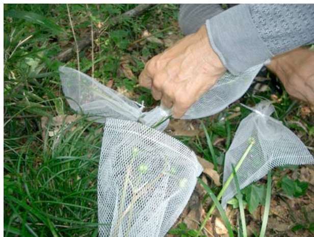
種子を確保するためのネット被せ