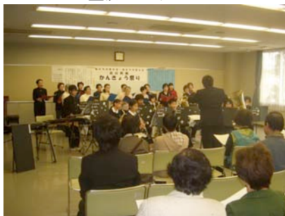
感動を与えた「不老川応援歌」