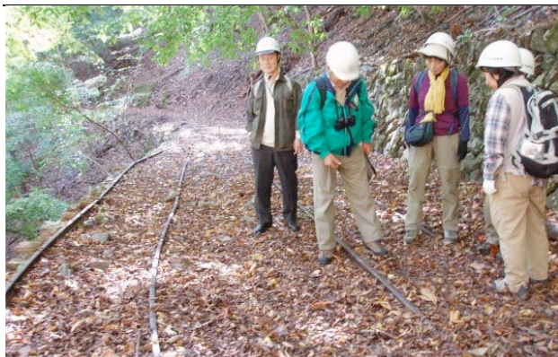
1969年まで木材搬出に使用されていたトロッコ軌道