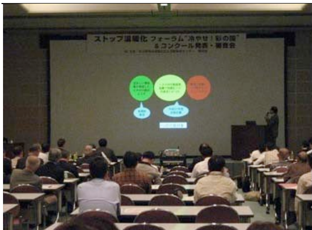
コンクール会場での発表の様子

埼玉県地球温暖化防止活動推進センターの主催による「冷やせ！彩の国コンクール」が10月25日に大宮ソニックシティ国際会議場で開催されました。発表は15団体と2個人の17の取組事例でした。