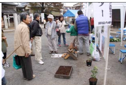
熊野神社での川越緑のサポーター