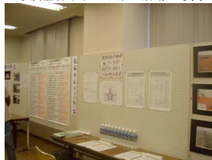
かわごえ環境ネットなどの展示

「私たちが始めよう環境行動」をテーマにした今年の北公民館かんきょう祭りが、11月15日(土)に開催されました。「かわごえアジェンダ21」の普及啓発を目的に、市内14高校にパンフレットを送り、生徒の参加を求めました。秋の忙しい時期での生徒の参加は難しかったようです。次世代の環境に対する取り組みを強めるために、来年の参加を求めるとすれば、新年度からのカリキュラムに組み込んでもらわなければならないようです。回答のあった5校の環境教育や生徒の感想・意見などを発表しました。