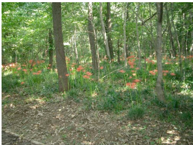
ヤブランの中に咲くヒガンバナ

リの球根の分球移植だけでなく、実生からの増殖も進めることにしました。今回は、ますます咲く数が増えてきたヒガンバナの状況と、キツネノカミソリを実生で増殖するための、種子の採取状況を報告します。(10月20日大辻晃夫)