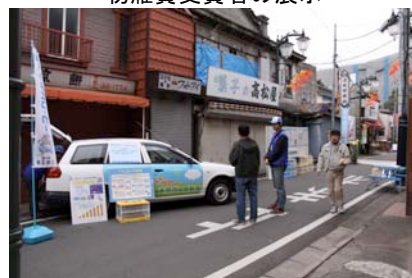
埼玉県青空再生課のエコカー