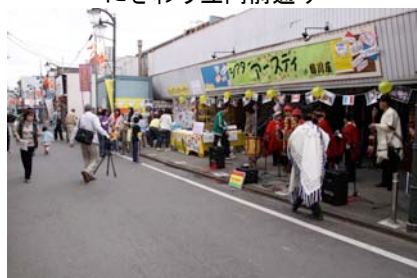
旧鶴川座前のパフォーマンス