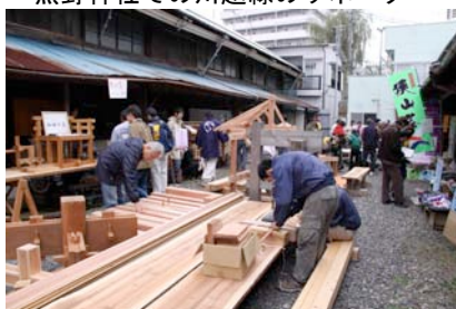
旧川越織物市場での木の家ネット