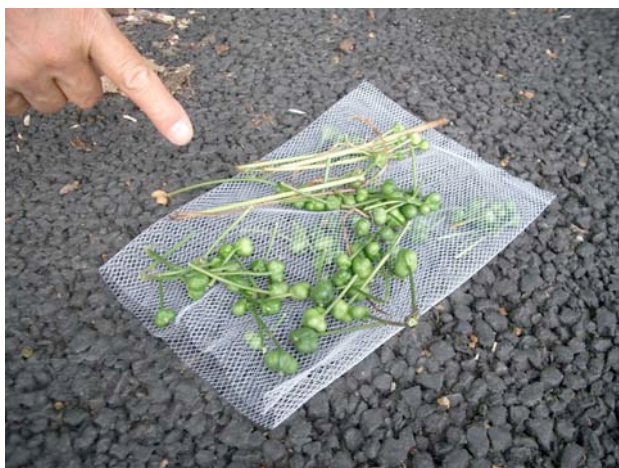
茎の折れた種は収集しました