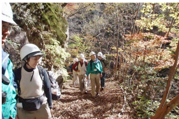
溪谷沿いの紅葉の道を行く。往復で徒歩3時間あまり。