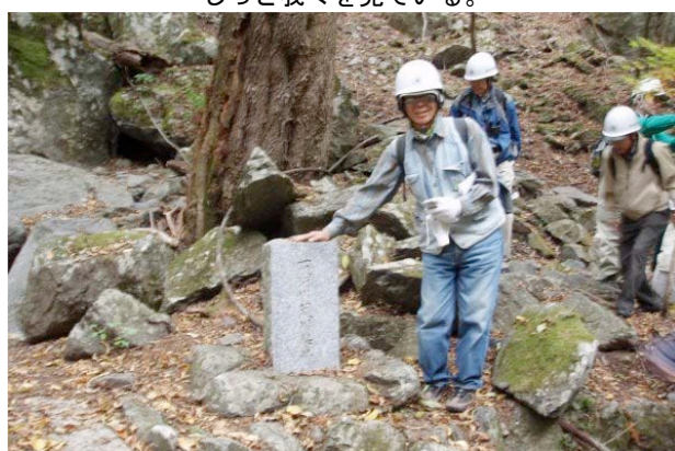
荒川起点の碑。ここから東京湾まで173kmの荒川の旅が始まる。