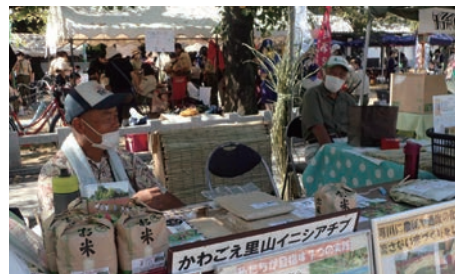
⑧ NPO 法人かわごえ里山イニシアチブ