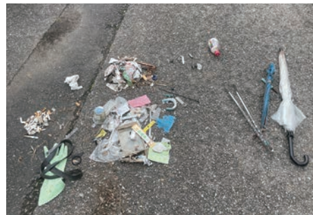
ゴミのサンプリング調査結果