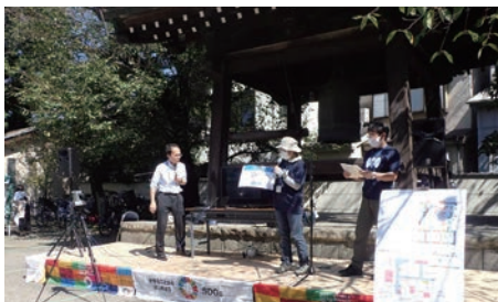
⑨埼玉県水環境課のプレゼンテーション