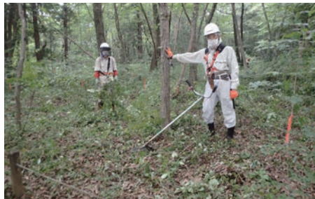
藪状の林床が歩けるように

増え林床も密になってきましたので、再生のための手入れを始めました。その第1回です。実のなる低木を残し、ヒサカキ、カシ類を除去しました。