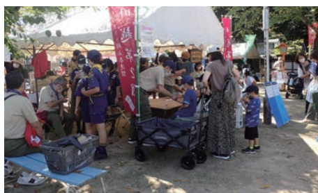
⑩ボーイスカウト川越第2団