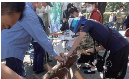
⑱かわごえ環境ネット「丸太切り」