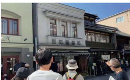
⑰東洋大学地域活性化研究所 & 仙波書房