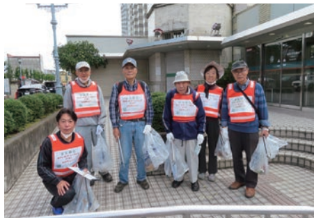
一番街(蔵造りの町並み)