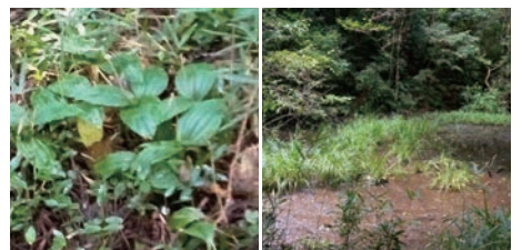
コクラン (絶滅危惧 IB 類) ヌマガヤ (絶滅危惧 IB 類)