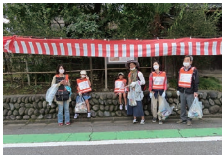
永島家住宅(旧武家屋敷)前で