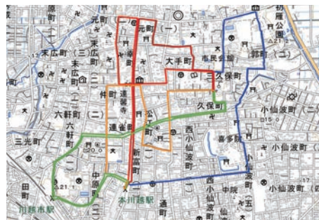
5コースの経路(地理院タイルに作図)