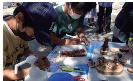
⑱かわごえ環境ネット「木工」