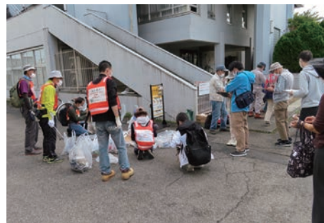
中央公民館での分別作業