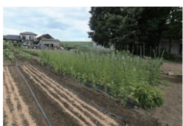
中老袋の koloro farm

「ベトナム小粋雑貨 Sunny Side Terrace (サニーサイドテラス)」(川越市幸町3-15) 通常営業時間 11:00-18:30、定休日：月曜日・火曜日、Tel.049-226-2908、E-mail: info@sunny-side-terrace.com (石川真)