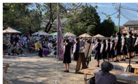
⑲川越女子高校音楽部の合唱