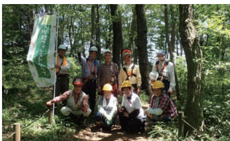
今回はフルメンバーに近いパワーで

7月12日(水)は「リョウブの森」のヒサカキ、シラカシなどの照葉樹をかなり片づけ、枯損木も10本ほど処理しました。