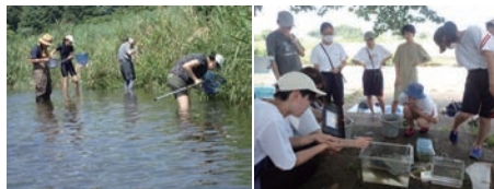
7/17 ガサガサで魚類調査 7/17 40cmのヘラブナを見つめる

7月16日(日)に今年第2回目の魚類調査調査をかほく運動公園向かいの親水ゾーンで行いました。気温が32℃、水温は29.5℃のこれまでにない高さです。オイカワ、コクチバスなどがかかりました。明るる17日(月・祝日)は川越女子高校生物部の生徒さん8人と松田先生が魚類調査されるのをサポートしました。生物部はエビ類の研究をしているとのことで、今回はヌカエビ、スジエビなどを標本に持ち帰りました。