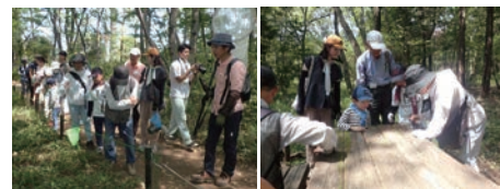
ナラ枯れの実態を見る 土の中いた虫を調べる