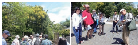
中院 モクゲンジの花を見上げる

次は中院です。アカマツの変異種である多行松のユニークな樹形と磨かれた幹の赤さに感心しながら歩を進めると、足元に黄色いじゅうたんが拡がります。見上げてみると楽しみにしていたモクゲンジの花が、樹木全体を覆うように咲き、梅雨空の下ひときわ黄色く鮮やかです。この観察会を6月に行うのは、モクゲンジの鮮やかな花を見ていただきたいからです。秋には黒い実ができて数珠に使われるそうで、お寺によく植えてある理由かもしれません。