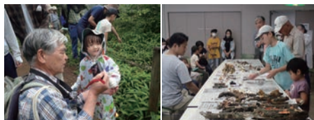
このキノコ、何ですか?

ひとしきり、森の中でキノコ探しをして、室内に持ち帰り鑑定です。思いのほか多く集まり40種ほどでした。興味津々の「万太郎少年」のような小学生が講師に次々と質問し、参加者とともにキノコについて理解を深めました。自然界には不思議がいっぱいです。この日はキノコだけでなく植物や虫たちとの出会いもありました。