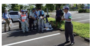
ごみ収集の仕方の説明