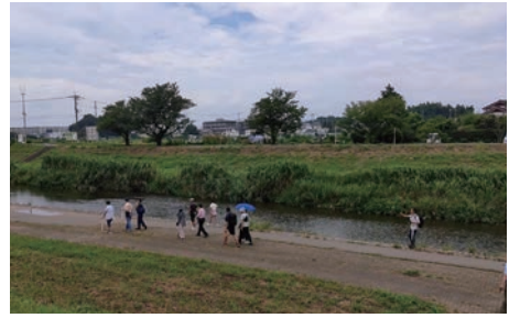
小畔川沿いを歩く