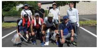
武州ガスと関連会社の皆様