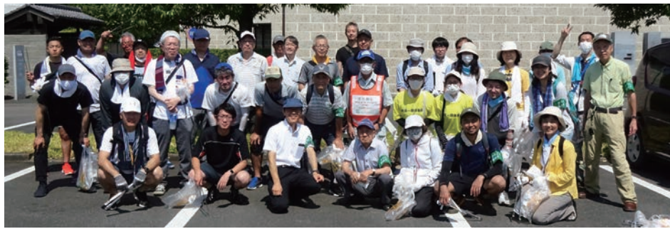
活動開始前の参加者集合写真

海の日7月17日（月）、猛烈な暑さの中、時間を短縮してクリーン活動を行いました。