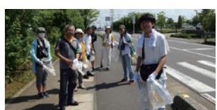
ごみ収集コーススタート