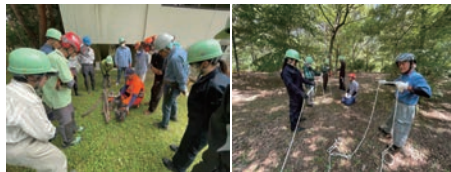
6/24 チェンソーの構造 7/22 ロープワーク

6月24日(土)に「チェンソー・刈払機安全講習会」、7月22日(土)「ロープ牽引システムを使った手鋸とチェンソーによる安全伐倒講座」を実施しました。