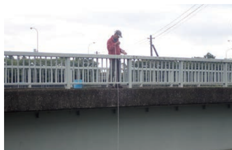
小畔川芳地戸橋採水の様子（6月2日） 田植えが終わっていて休耕田は草ぼうぼう