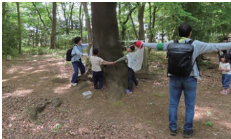
ヤマザクラの大木の周囲を測る