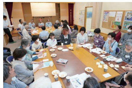
2023年の第1回環境対話カフェの様子