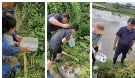
ホタルの幼虫の放流

1 7月13日(土) 午前マコモで盆ござ、牛・馬づくりワークショップ、2 8月10日(土) 午前・午後大ござづくりワークショップ。参加希望の方は当会にお問い合わせください。