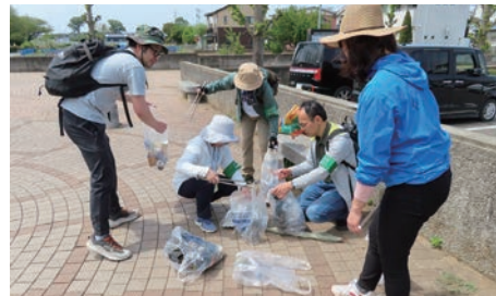
活動終了後のごみの分別