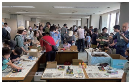
2 盛況だったつるがしま市民環境まつり