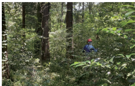
3 しばらく下刈りしていない場所は藪に