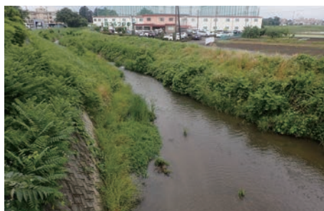
南小畔川庚申橋から上流（6月2日） わずかに濁りがあり水質はよくない