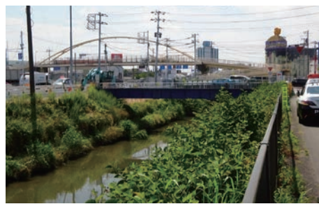
新河岸川新琵琶橋から下流（6月15日） 橋架工事中、水量は普段と変わらない