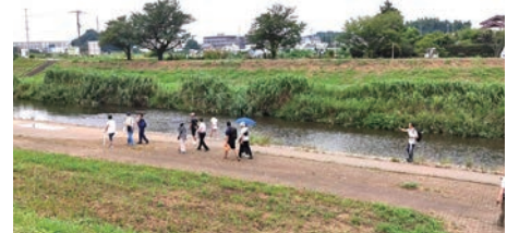
親しみのある小畔川を歩く