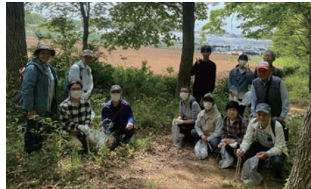
長距離コース(大人の部)集合写真