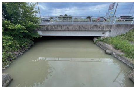
九十川二枚橋から下流（6月2日） けっこう深くて水が淀んでいる