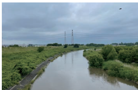
入間川雁見橋から上流（6月2日） 例年より濁っていて浮遊物と水量も多い