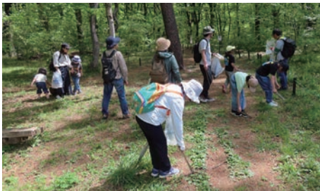
お散歩コースの活動の様子