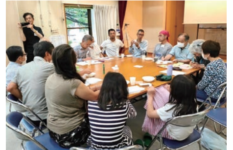
環境対話カフェの様子