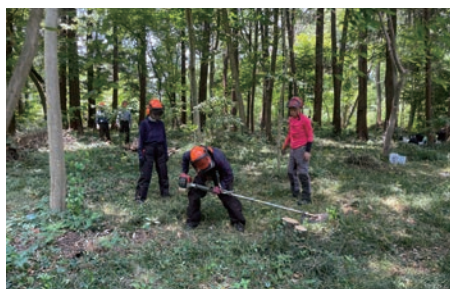
4 刈払機の安全除草作業を実践的に学ぶ