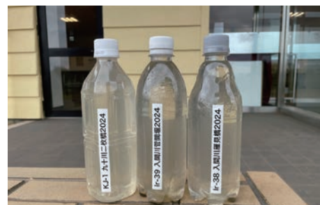
採水した水（6月2日） 入間川の水は沈殿物が多く見られる