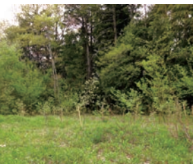
コナラの植樹エリア