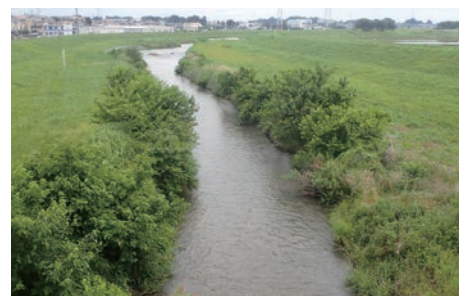
小畔川八幡橋から下流（6月2日） 土羽だった護岸が一部コンクリートに