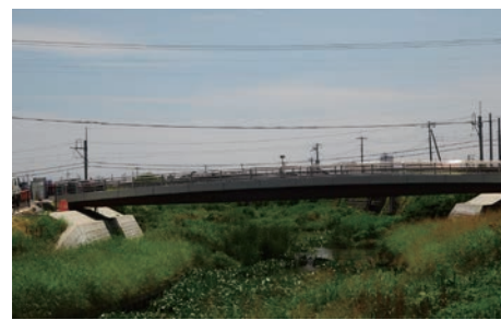
新河岸川畳橋から下流（6月15日） 魚体の大きな鯉が多数泳いでいた