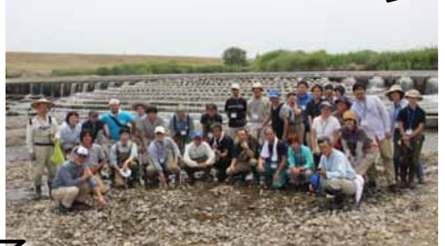
公益財団法人サイサン環境保全基金助成事業

越辺川水系にアユはどこまで上れ、どこで上れなくなってしまうのか？入間川で進められている魚道設置事業に対し、これから取組むべきことはなにか？東京湾から戻ってくる自然溯上のアユを復活するための市民・行政・関係団体の連携について語り合います。