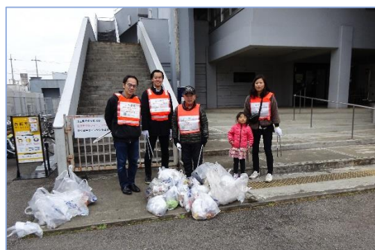
分別後のごみの量を撮影