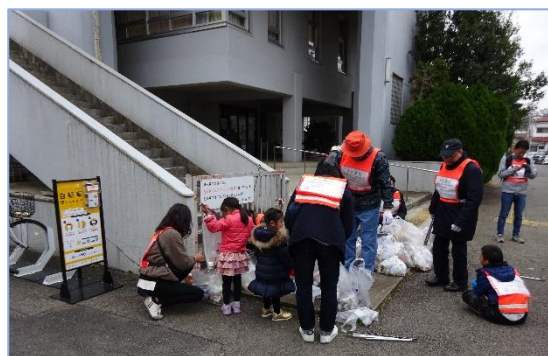
中央公民館 分別作業