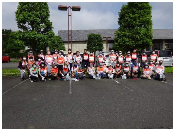
2020年7月 郊外クリーン活動 やすらぎの里で マスクを着けて

広報川越、SNS、口コミ等を活用して参加者を広く多く集め、更に住みやすい街川越にしたいと考えております。ご支援の程よろしくお願いたします。