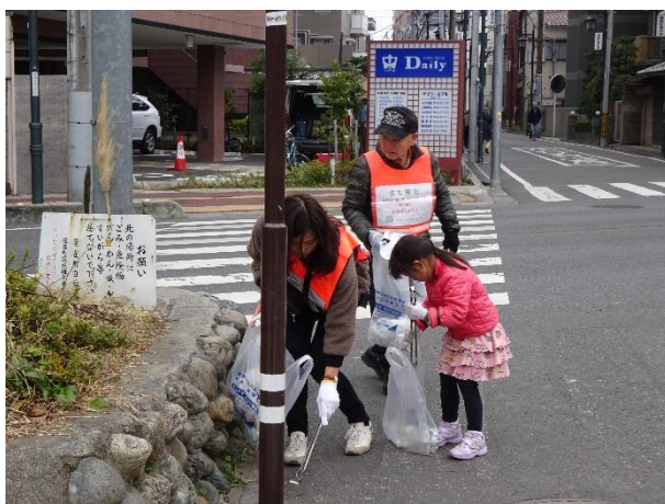
2019年12月 歳末まち美化活動 親子で参加